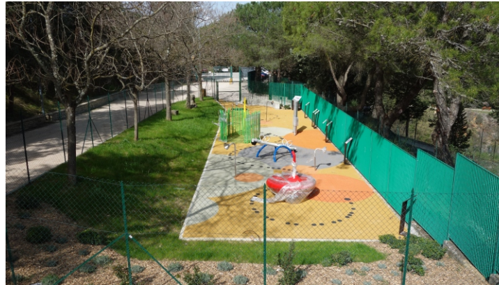
Area educazione sensoriale