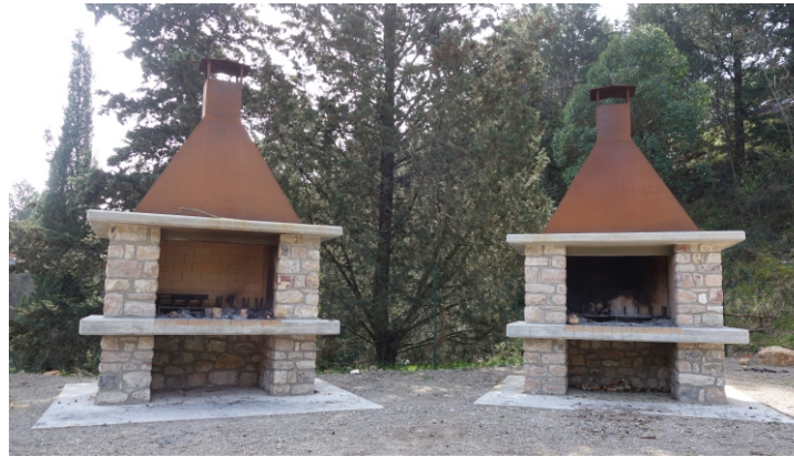
Area picnic (camini)

Assessore alle Politiche Agricole e Patrimonio Paesaggistico Regione Umbria