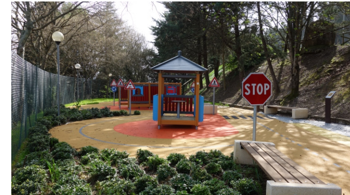
Area educazione stradale