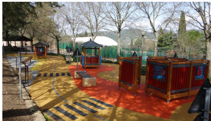
Area educazione stradale