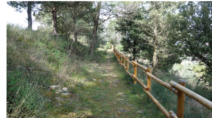
Sentiero nordic walking

SABATO 16 aprile 2016 ore 10,00 PARCO LACUGNANO - PERUGIA